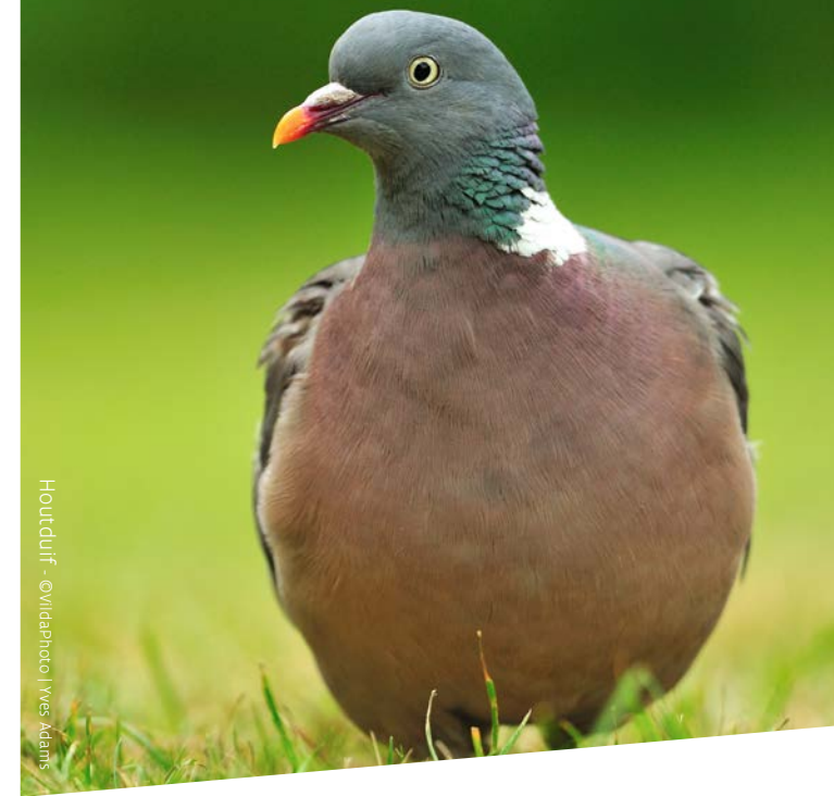
Houtduif - ©VildaPhoto | Yves Adams