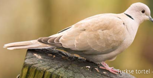
Turkse tortel

Let op: na publicatie van deze folder, kan de wet gewijzigd zijn. Kijk voor de meest actuele informatie op www.natuurenbos.be .