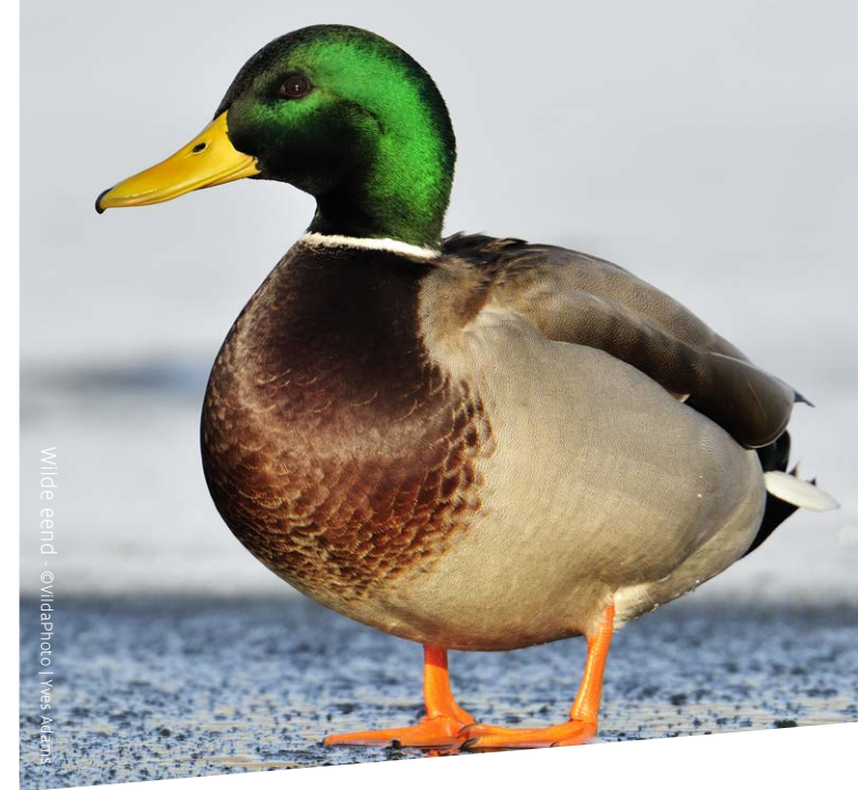
Wilde eend

Let op: na publicatie van deze folder, kan de wet gewijzigd zijn. Kijk voor de meest actuele informatie op natuurenbos.vlaanderen.be .