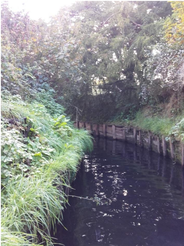
Figuur 1 – Foto van de Terkleppebeek genomen op het eerste traject.

Het onderzoek werd uitgevoerd aan de monding van de Terkleppebeek (figuur 1) gelegen te Geraardsbergen op twee verschillende trajecten (figuur 2, tabel 1). De afvissing vond plaats op 3 oktober 2017.