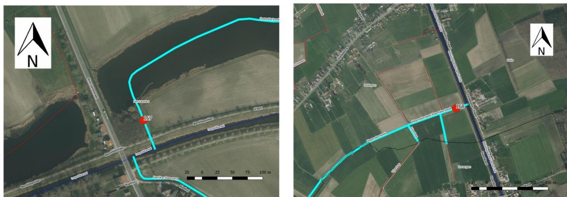
Figuur 1 - overzicht van de drie onderzochte locaties (voor de info over de locaties verwijzen we naar tabel 1).