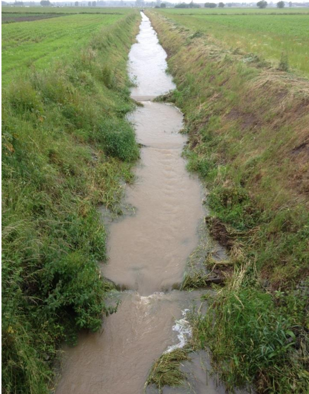
Figuur 3 – foto genomen van de vistrap aan de Wagemakerstroom in juni 2016.