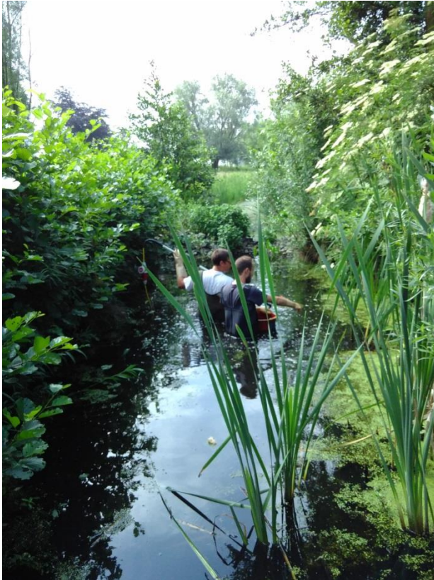
Figuur 2 - foto van de afvissing aan de vistrap van de Landegembeek.